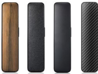
DECT-Telefonhörer Holz S30853-H4020-R121 Leder S30853-H4020-R111 Kunststoff S30853-H4020-R101 Carbon S30853-H4020-R131