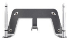
Kit für Wandmontage S30853-H4030-R101